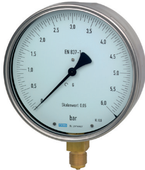
Feinmessmanometer, Typ 312.20